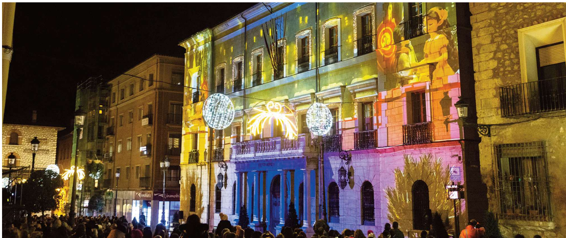
La fachada del Ayuntamiento de Teruel fue el escaparate de la proyección. Javier Escriche