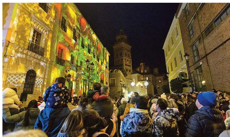
La plaza de la Catedral se llenó para ver este espectáculo digital.