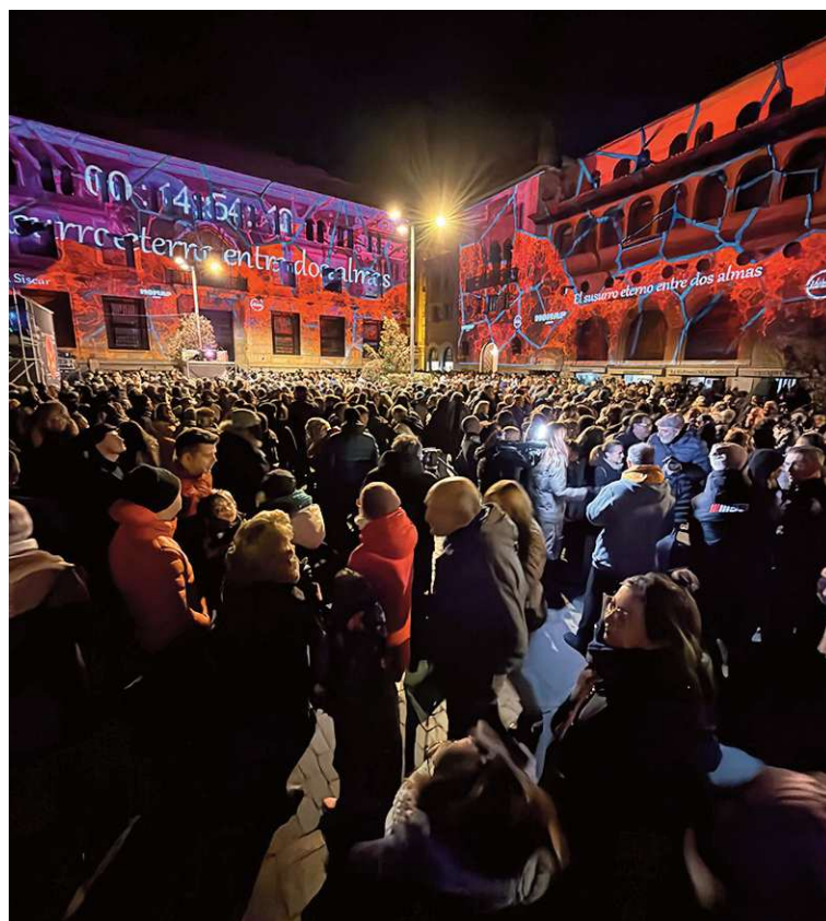
Proyección del videomapping en la plaza San Juan a finales de noviembre

La reposición de febrero se conecta con la promoción turística desarrollada en las últimas semanas, después de que el proyecto fuera presentado en Fitur (Feria Internacional de Turismo) como uno de los reclamos vinculados a la 30ª edición de Las Bodas de Isabel, que se celebrará del 19 al 22 de febrero en la ciudad. En ese marco, el Ayuntamiento situó el videomapping como un recurso de apoyo a la proyección exterior de una cita ya consolidada en el calendario cultural turolense.