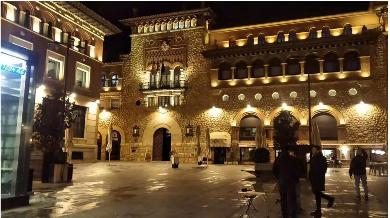
El plan contempla la mejora del alumbrado exterior de la plaza San Juan.

La recuperación de las escaleras de acceso al Cementerio, la renovación del alumbrado exterior de la plaza de San Juan y la mejora integral de las calles Córdoba y Granada forman parte del Plan de Cohesión, Diversificación y Valoración de Recursos Turísticos de Teruel, financiado con los fondos Next Generation EU